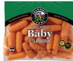
Baby Carrots US Pqte. de 1 Lb. Reg. $1.99 Pqte.