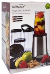
Brentwood Multi Pro Blender 20 PCS Reg. $34.99 *SVT