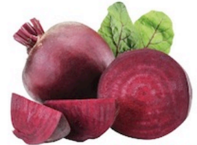
Remolacha De México Reg. $1.29 Lb.