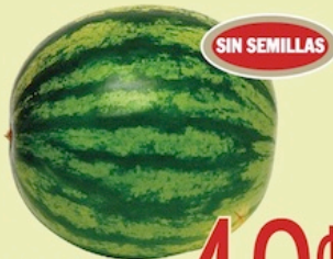
Melón de Agua Entero. Sin Semillas De Puerto Rico Reg. 79¢ Lb.