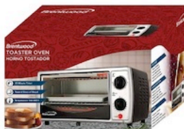
Brentwood Oven Toaster Silver Reg. $39.99 *SVT