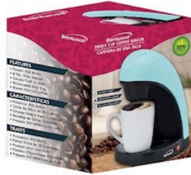
Brentwood Coffee Maker Single Cup Reg. $19.99 *SVT