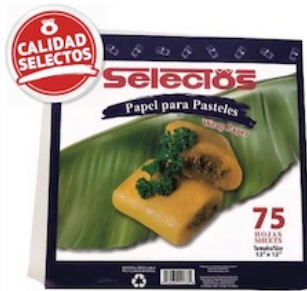
Selectos Papel para Pasteles Pqte. de 75 Reg. $1.99 Pqte.