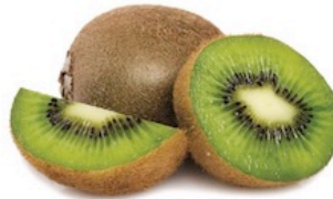
Kiwi Suelos De Italia/Grecia Reg. 69¢ c/u Especial 45¢ c/u