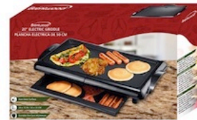
Brentwood Electric Griddle Negra Reg. $34.99 *SVT