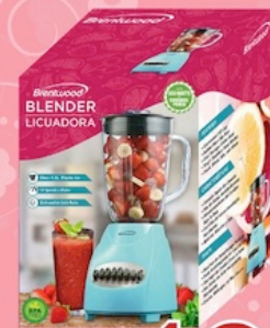
Brentwood Blender 12 Speed, Blue Reg. $21.99 *SVT