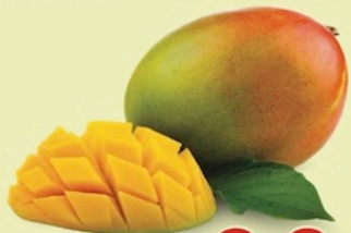
Mango Kit De Puerto Rico Reg. $1.49 Lb.