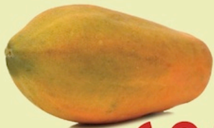
Papaya Entera De Puerto Rico Reg. 99¢ Lb.