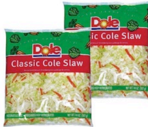
Dole Classic Cole Slaw US Pqte. de 14 oz. Reg. $2.99 c/u Especial $2.50 c/u