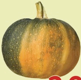
Calabaza Entera De Puerto Rico Reg. 59¢ Lb.