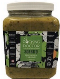
Cooking With My Doctor Salsa a la Criolla/ Sofrito con Cúrcuma y Aji Dulce Env. de 64 oz. Reg. $6.99 c/u