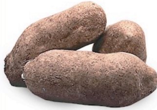
Ñame Florido Suelto De Colombia Reg. 99¢ Lb.