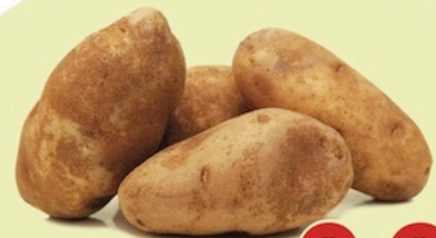
Idaho Papas para Hornear US Reg. $1.19 Lb.