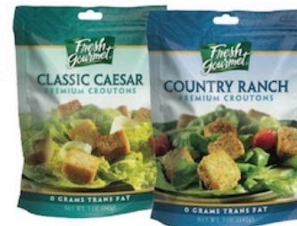
Fresh Gourmet Croutones. Variedad Pqte. de 5 oz. Reg. $2.29 c/u Especial $2.00 c/u