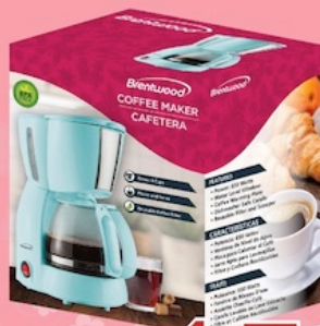
Brentwood Coffee Maker Blue Reg. $19.99 *SVT