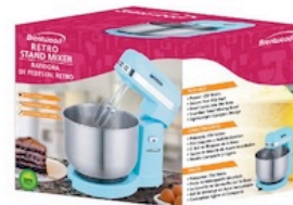
Brentwood Retro Stand Mixer 5 Speed, Blue Reg. $49.99 *SVT