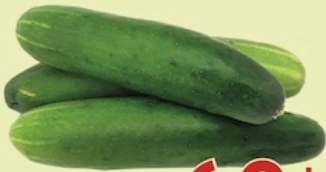
Pepinillo De Puerto Rico Reg. 99¢ Lb.