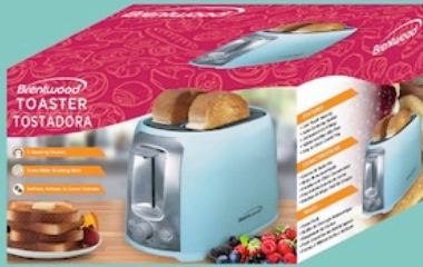
Brentwood Cool Touch Toaster 2 Slice, Blue Reg. $19.99 *SVT