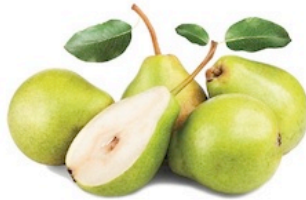
Peras Verdes Washington, Argentina, Chile Pqte. de 3 Lbs. Reg. $3.99 Pqte.